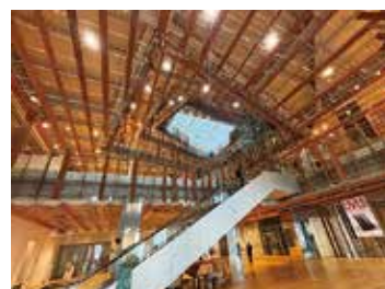
富山市ガラス美術館