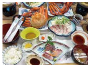
紅ズワイガニとブリしゃぶしゃぶ