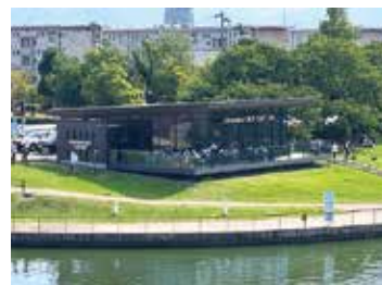
世界一美しい スターバックス・コーヒー