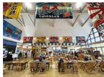
新湊きっとときと市場