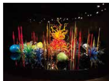
色鮮やかなガラス作品