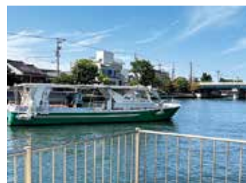
富岩水上ラインの遊覧船