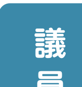
安曇電設 代表取締役 安曇電設